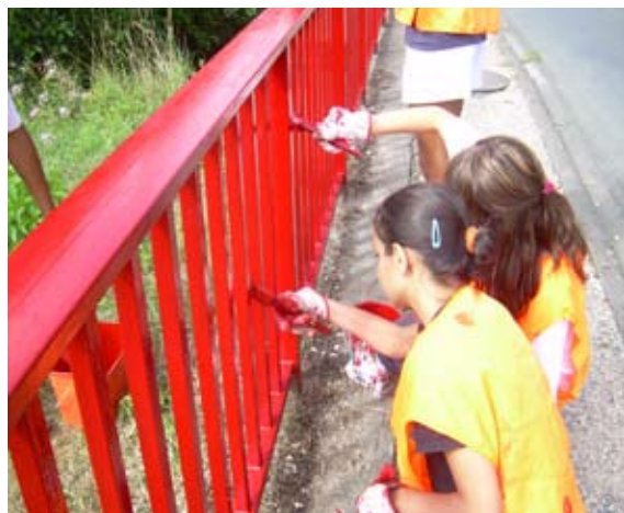
Travaux de peinture du pont à Florimont

+ d'infos sur www.cc-dufumelois.com/Chantiers-Jeunes.html