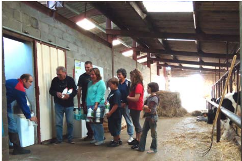
A la Croix de Balen, à Trentels, on expérimente déjà avec succès la vente directe de lait.