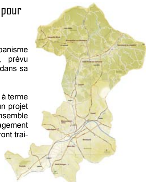
Le PLUi, un instrument global pour le territoire

Son adoption permettra à terme de doter le territoire d'un projet global, dans lequel l'ensemble des questions d'aménagement et de constructibilité seront traitées.