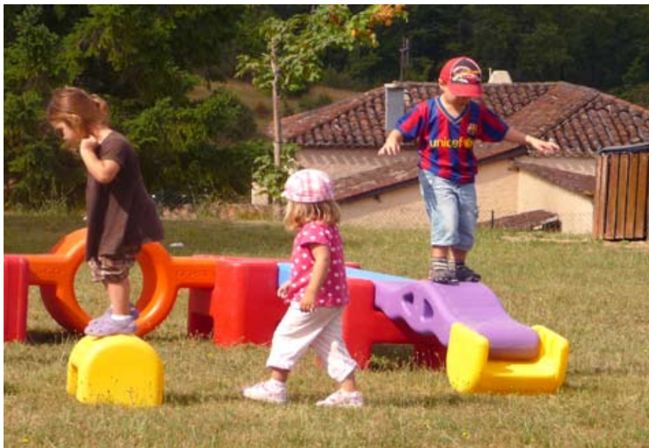
Le transfert de la crèche est effectif depuis le 1er juillet 2010

La Souris Verte est ouverte du lundi au vendredi, de 7h30 à 18h30, pour une capacité d'accueil de 45 enfants. Les centres de loisirs sont quant à eux ouverts les mercredis et durant les vacances scolaires. ■