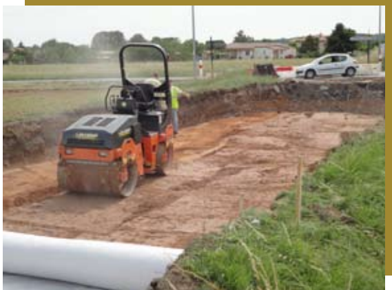
Une nouvelle structure de chaussée sur 75 mètres.