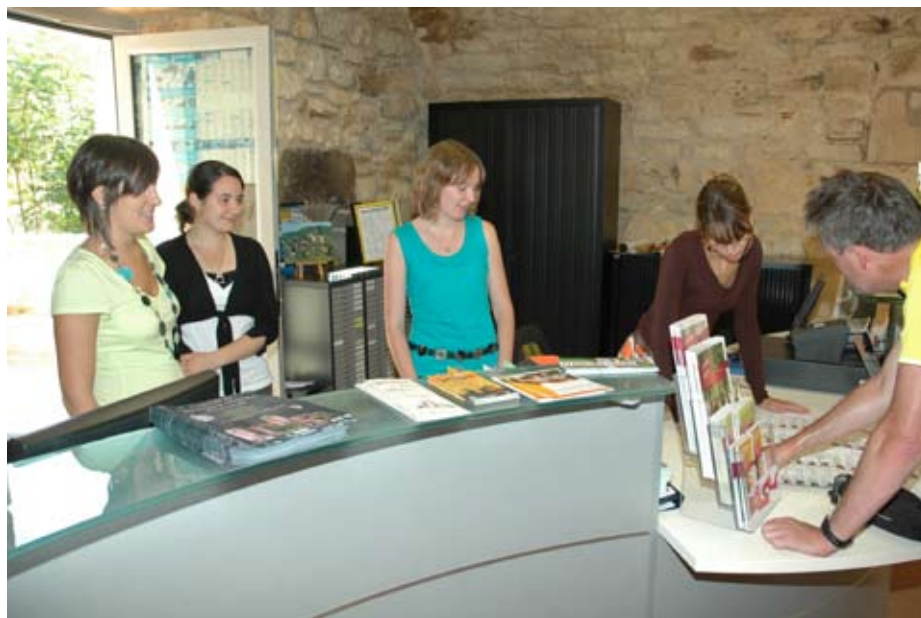
Une affluence en hausse pour l'équipe de l'office de tourisme.

La boutique, qui a ouvert ses portes en juillet 2010 à l'OTFL a permis aux