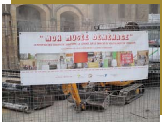
La banderole créée par les jeunes écoliers de Sauveterre.

La création d'une banderole, témoin de ce remarquable travail, est d'ailleurs visible depuis les grilles du chantier.